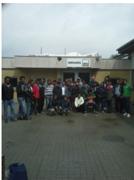
Holdet på Langaa Skole