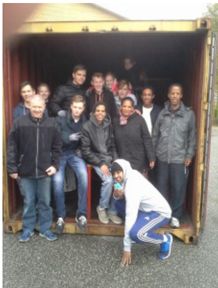
Holdet på Rytterskolen